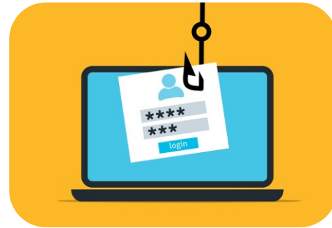
การหลอกลวง (Phishing/Scam)