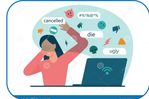
เนื้อหาไม่เหมาะสม (Offensive Content, Harassment and Threats)