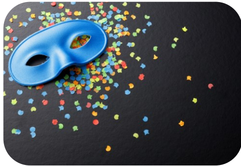
การขโมยตัวตน (Fraud/Identity Theft)